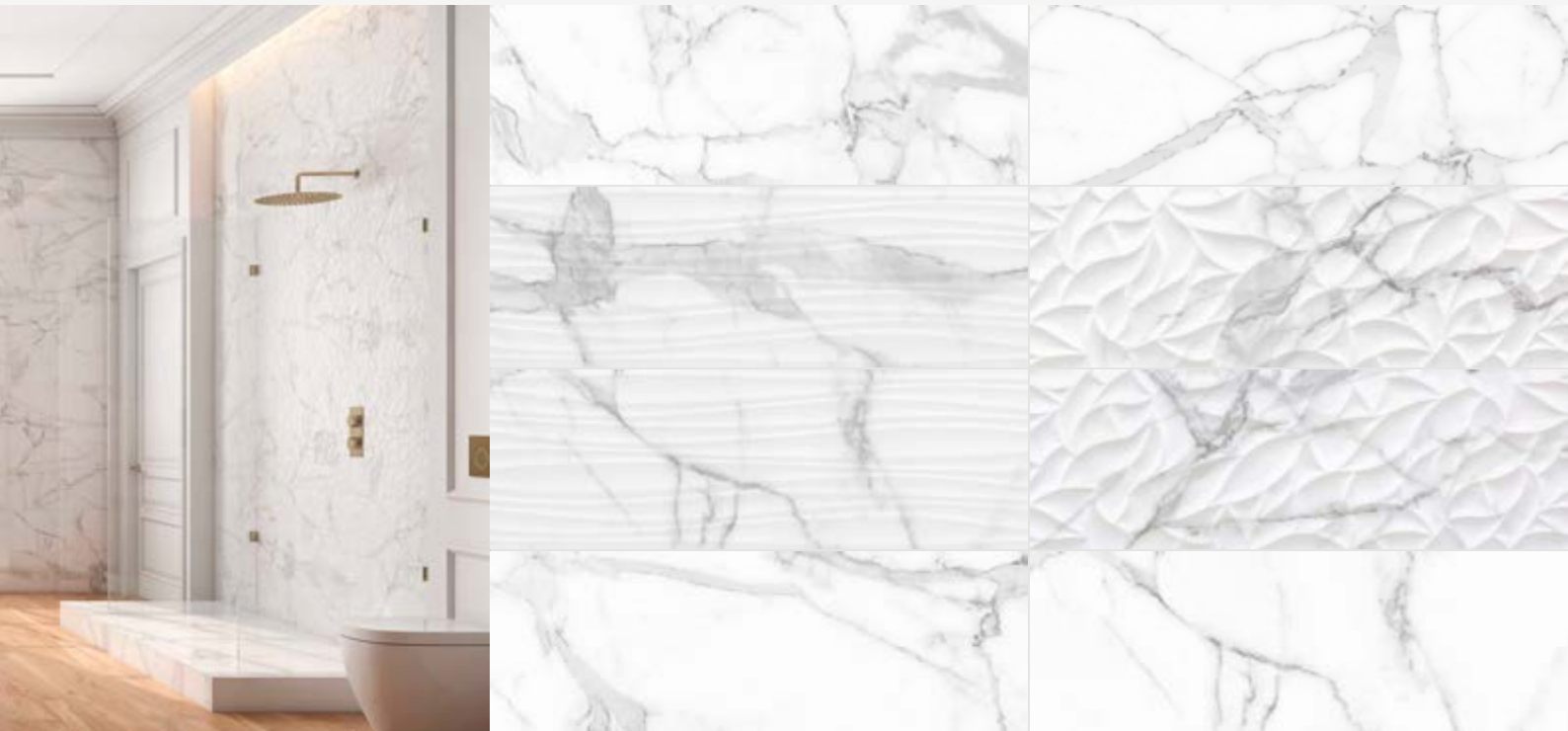
Tabla Técnica | Technical Chart | Scheda Tecnica

Pasta Blanca | White Body | Pasta Bianca