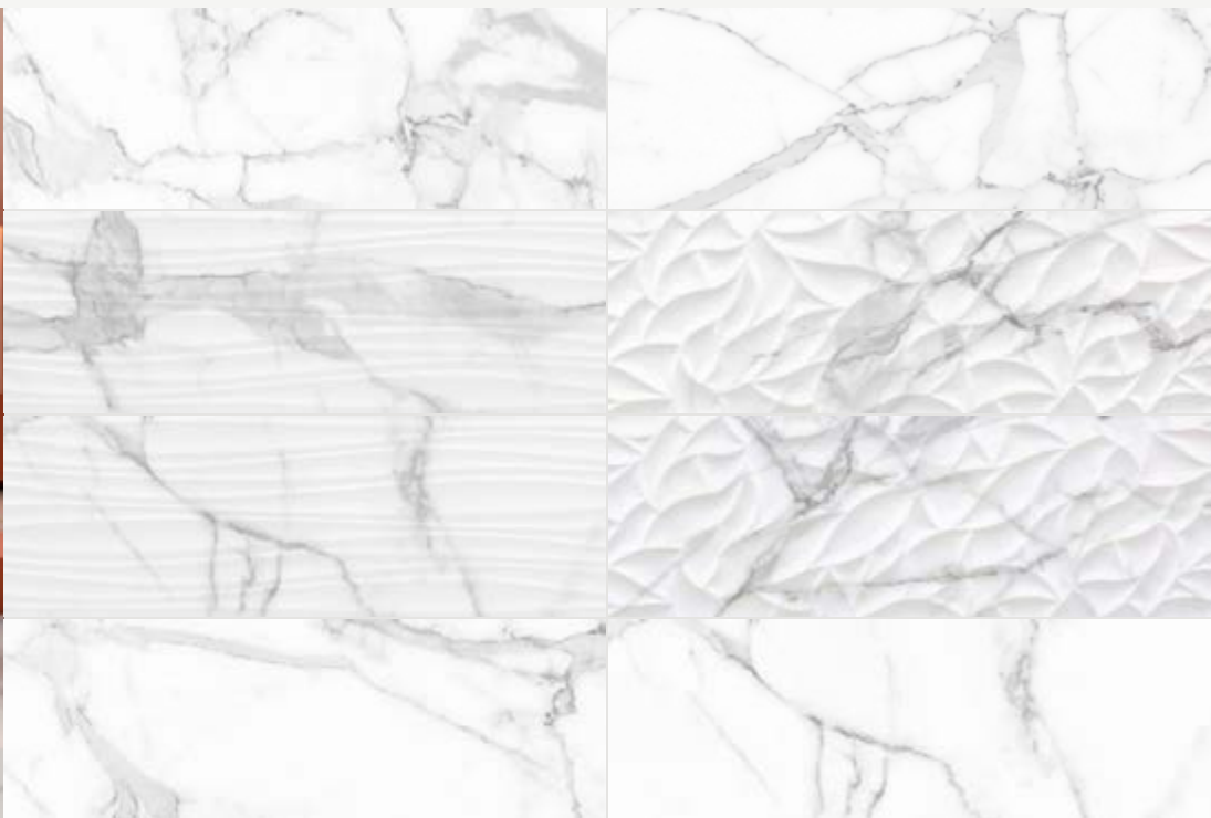
Tabla Técnica | Technical Chart | Scheda Tecnica

Pasta Blanca | White Body | Pasta Bianca