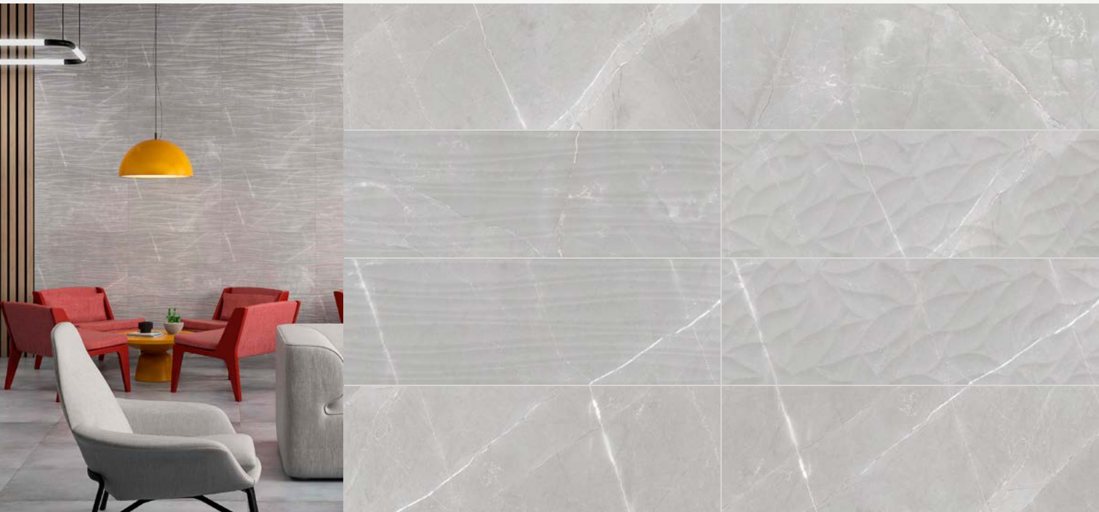
Tabla Técnica | Technical Chart | Scheda Tecnica

Pasta Blanca | White Body | Pasta Bianca