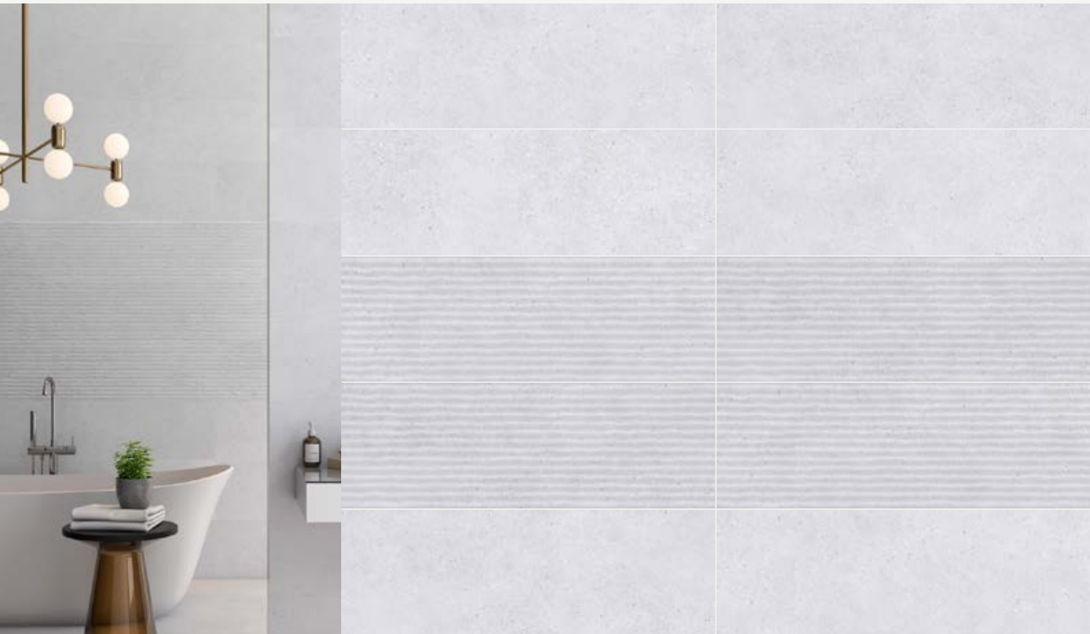
Tabla Técnica | Technical Chart | Scheda Tecnica

Pasta Blanca | White Body | Pasta Bianca