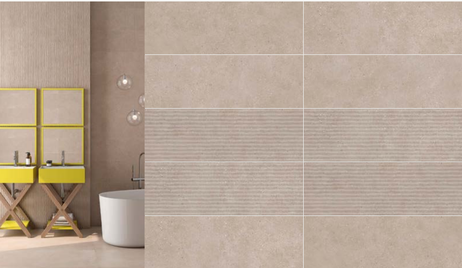
Tabla Técnica | Technical Chart | Scheda Tecnica

Pasta Blanca | White Body | Pasta Bianca