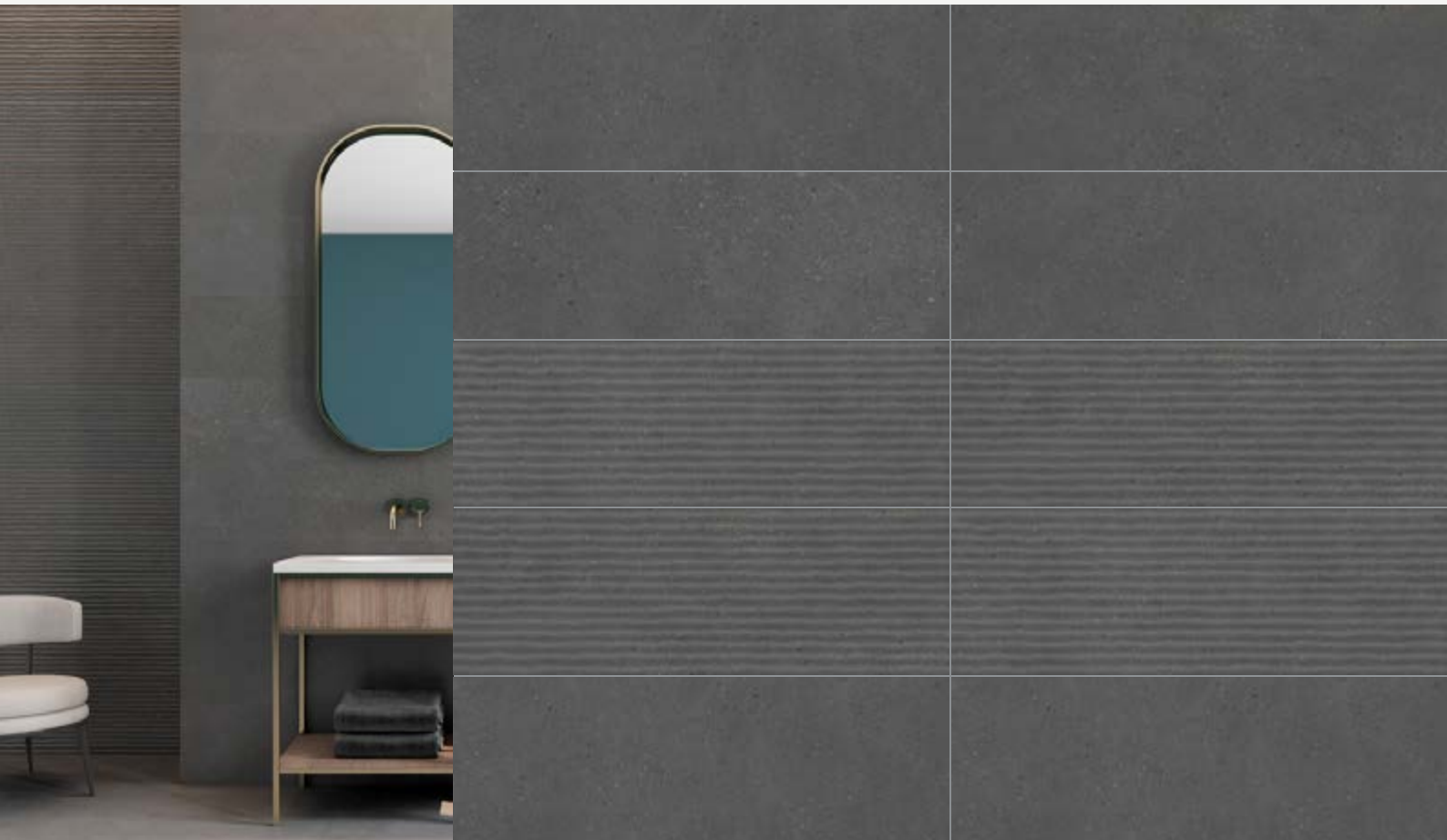
Tabla Técnica | Technical Chart | Scheda Tecnica

Pasta Blanca | White Body | Pasta Bianca