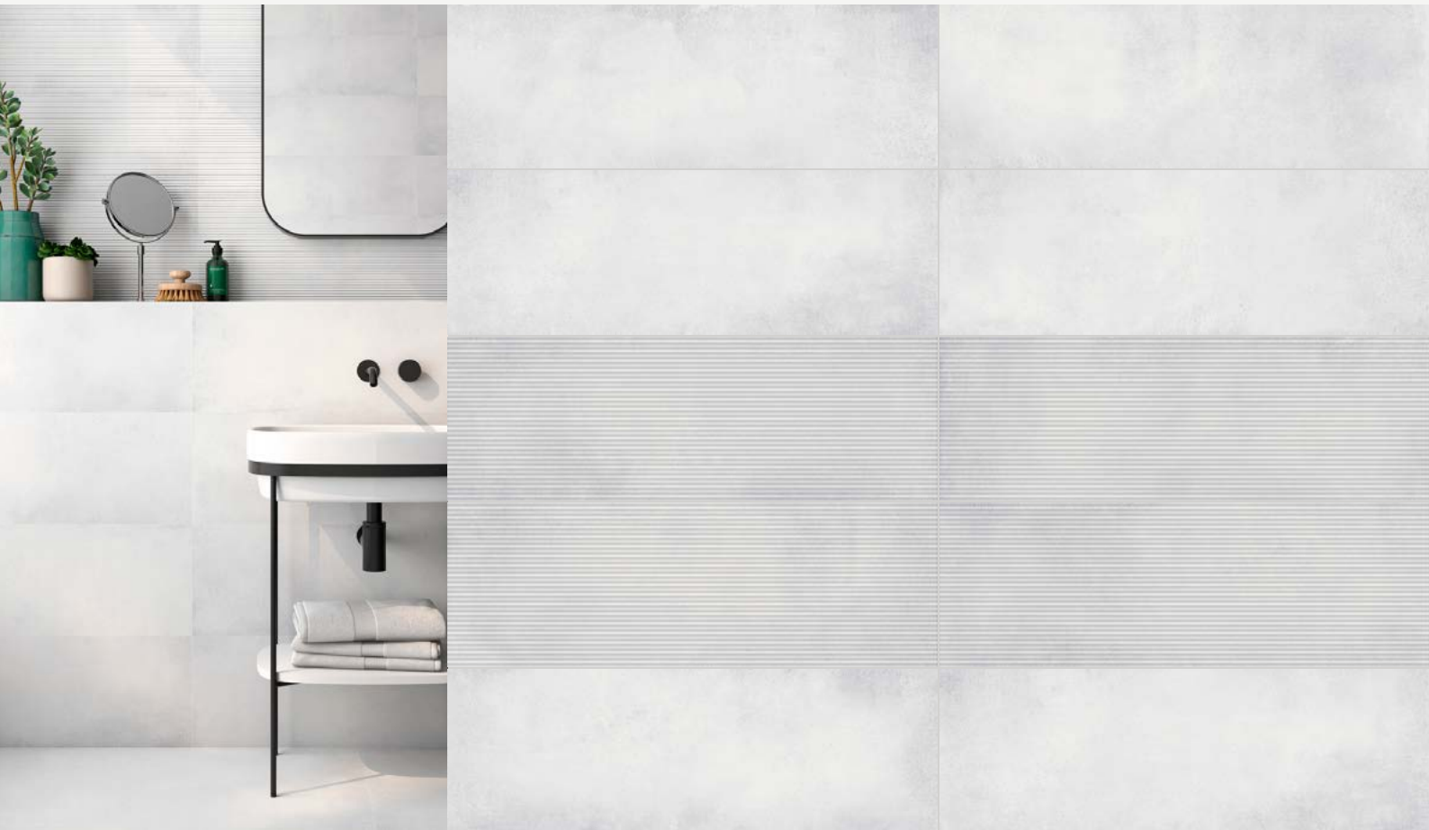
Tabla Técnica | Technical Chart | Scheda Tecnica

Pasta Blanca | White Body | Pasta Bianca