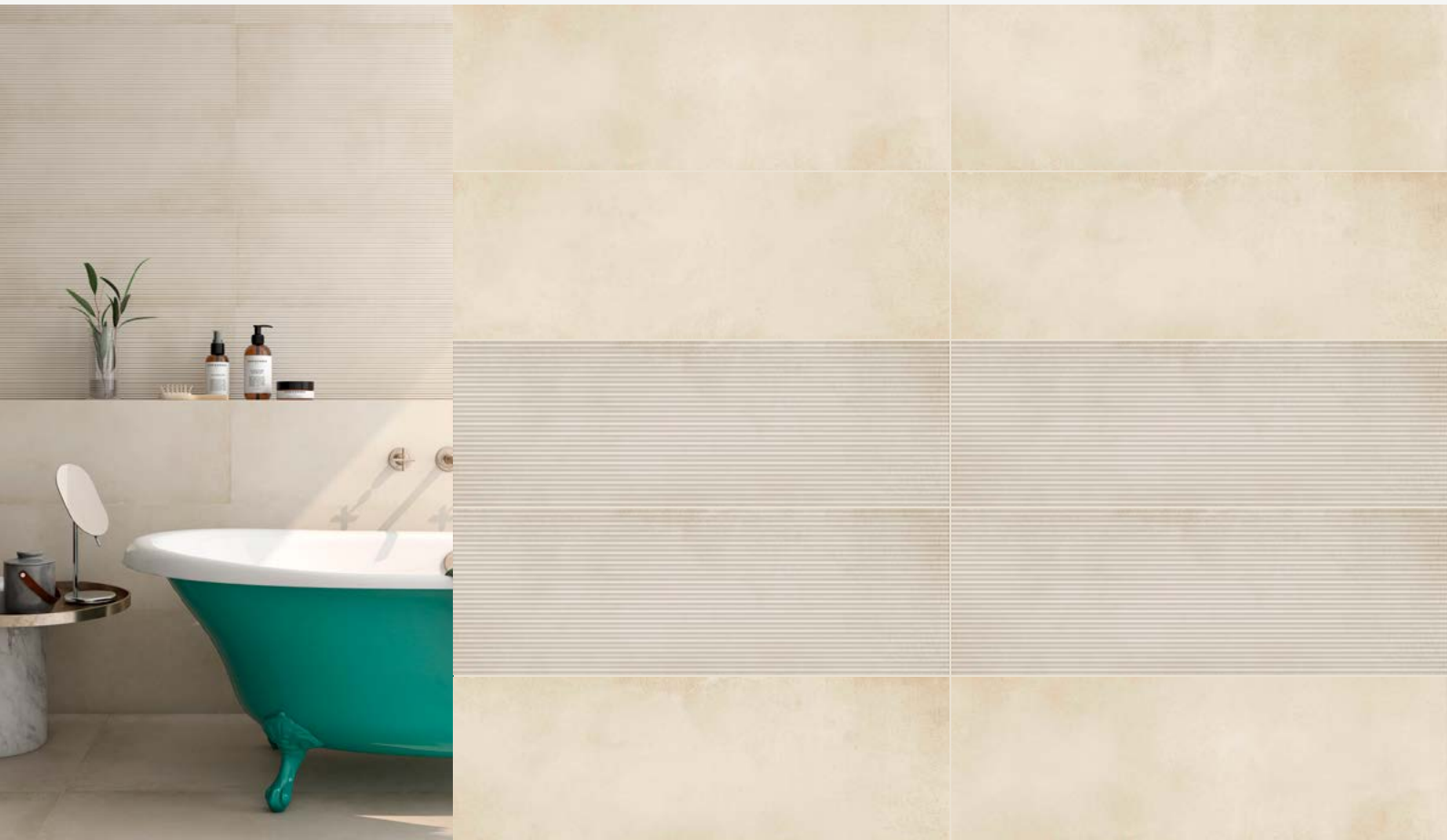
Tabla Técnica | Technical Chart | Scheda Tecnica

Pasta Blanca | White Body | Pasta Bianca